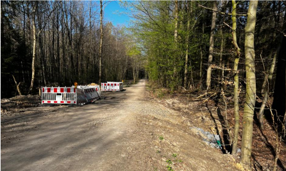
Bild 10: Einbau von Abflussleitungen ; für den Hochwasserschutz negativ. Der Wald sollte als natürliches „Regenrückhaltebecken bei Hochwasser“ dienen.